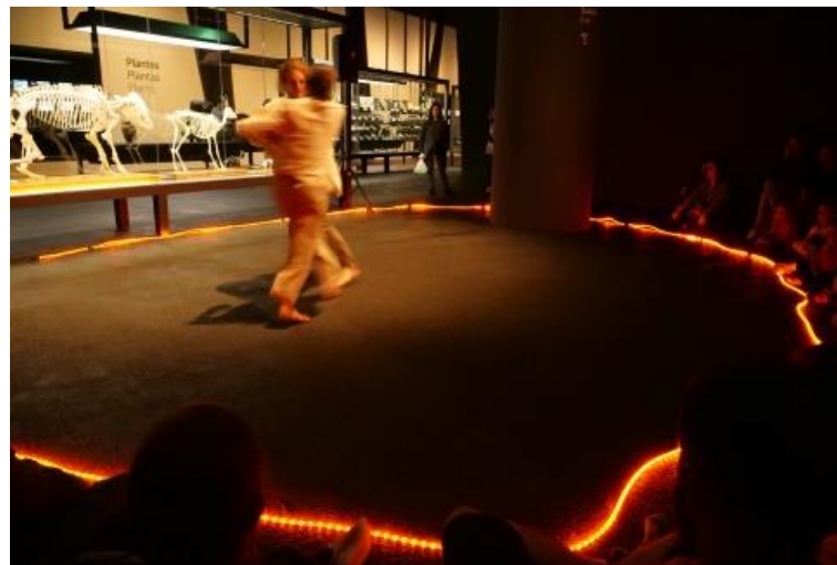
La plaça central dins l'exposició Planeta Vida, amb la vitrina d'esquelets com a teló de fons.