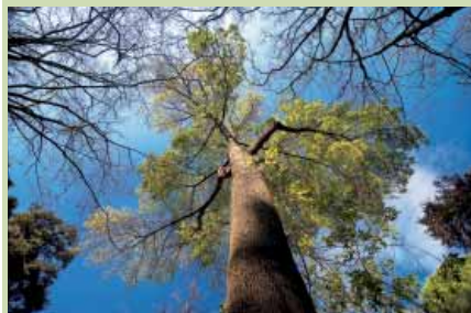
Aquest freixe de fulla petita és l'arbre més alt del Jardí

Prop del llac hi viu un carpí , molt utilitzat als jardins d'Europa central, però del qual només es coneixen dues localitats espontànies a la Península. La noguera alada de Rehder * és l'arbre més gran i robust del seu entorn, un híbrid molt atractiu pel seu port, per la seva coloració tardoral i pels decoratius penjolls que formen flors i fruits. Al costat del rierol hi ha un freixe de fulla petita , l'exemplar més alt del jardí i un dels més alts de la ciutat. Les dimensions de la seva capçada no s'aprecien bé des de la base, però a la tardor, quan les fulles canvien de color, s'identifica perfectament des del camí de baixada. Al seu costat creix un plàtan fals , un espècie de port mitjà que, per les condicions òptimes de l'indret, ateny els 40 m d'alçada.