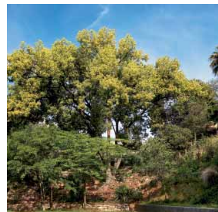
La capçada del gran camforer presideix el Sot de la Masia

La capçada del gran camforer s'eleva ampla i ufanosa sobre el Sot de la Masia, mentre les seves arrels es relliguen amb formes curioses que les ajuden a ancorar-se millor al pendent del terreny. Els camforers, originaris del sud-est asiàtic, són arbres mil·lenaris de la família de les lauràcies. Tenen les fulles coriàcies, ovalades o el·líptiques, de color verd brillant, i les flors molt petites i de color groc verdós. A partir d'un procés de destil·lació de la fusta s'obté la càmfora, amb nombrosos usos medicinals.