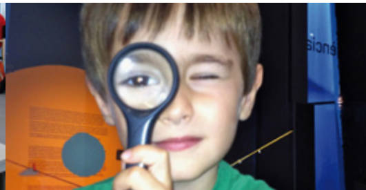
Imatge: Margarida Lorán