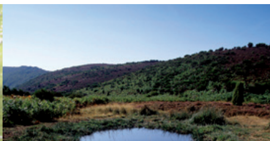
Imatge: Jordi Vidal