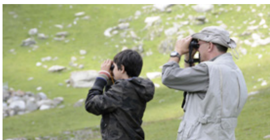
Imatge: Joan Carles Senar

Fes-te amic! Retorna la butlleta emplenada o contacta amb nosaltres!