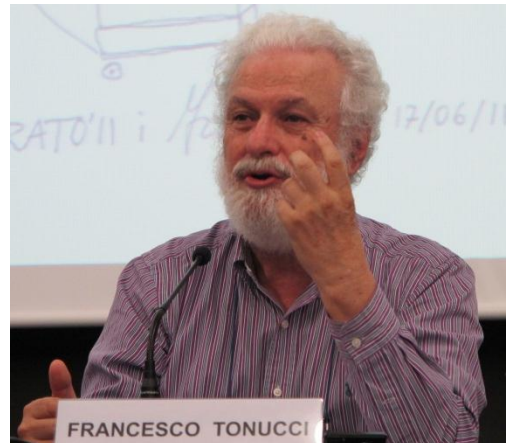
Conferència "El paper de la comunitat en l'educació dels infants". Museu de Ciències Naturals de Barcelona. 2012

L'objectiu del projecte de la ciutats dels infants i els seus consells era tractar d'aconseguir que l'Administració baixés els seus ulls fins a l'altura d'un nen, per no perdre de vista a ningú. Una ciutat adequada als nens és una ciutat adequada per a tots i va caldre demostrar que el infants eren absolutament capaços d'interpretar i d'expressar les seves pròpies necessitats i contribuir al canvi de la seva ciutat, donat que les seves necessitats coincideixen amb les de la major part dels ciutadans, sobretot amb les dels més febles. Per aconseguir aquest grau de participació va caldre posar l'èmfasi en el protagonisme infantil i en el seu dret a participar en les decisions que els afecten sense ser utilitzat pels adults com a cobertura de les seves responsabilitats.